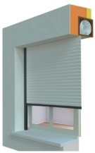
enroulement intérieur N° 1 et 9