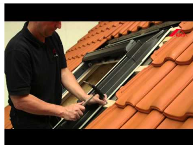
Pose Roto Q4