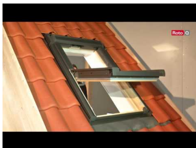
Présentation - Fenêtres de toit Roto Q4