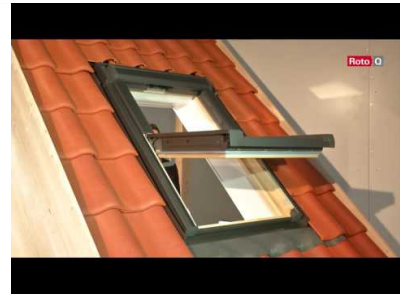
Présentation - Fenêtres de toit Roto Q4