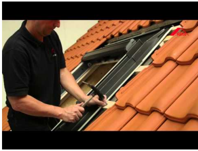
Pose Roto Q4