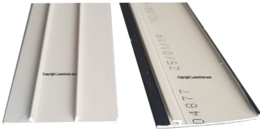
Ancien profil de finition qui n'est plus livré depuis février 2019