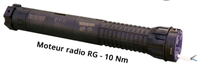
Moteur radio RG - 10 Nm