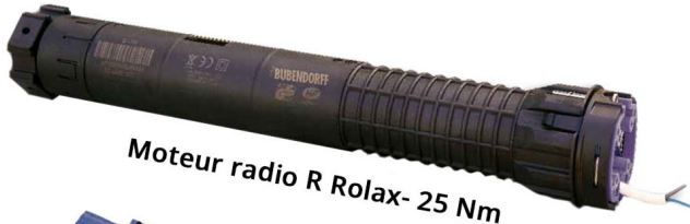
Moteur radio R Rolax- 25 Nm