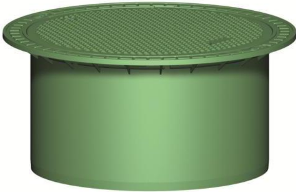
Mini rehausse télescopique