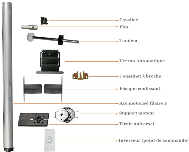
Diagramme Clés BUBENDORFF

* Sachet de visserie inclus dans le kit mais non représenté.