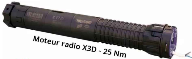
Moteur radio X3D - 25 Nm