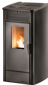
ARTE ACCIAIO 10 kW