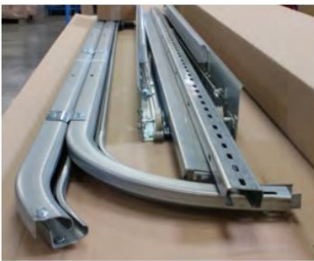
Rails et ressorts pré-assemblés